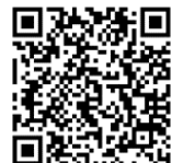
【参加申込 QR コード】