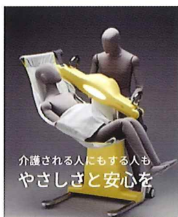
介護される人にもする人も やさしさと安心を