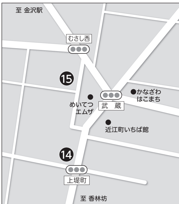
武蔵ヶ辻エリア (金沢駅よりタクシーにて約8分)